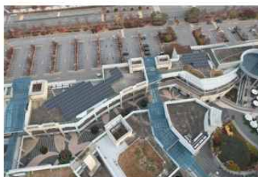
[김해시 신문동 롯데*]