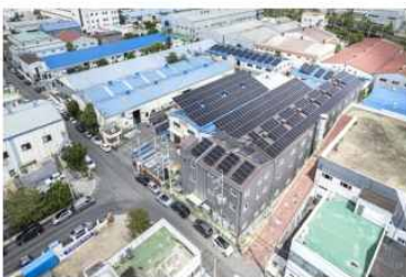
[김해시 어방동 문*]