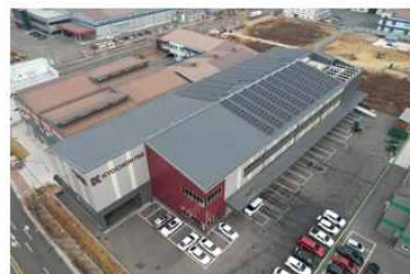
[김해시 진례면 교*]